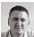
WILFRIED BASTIEN APF POOL DESIGN